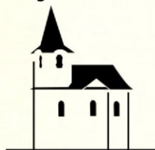
kostel sv. Matěje

adresa: U Matěje, Praha 6 spojení: autobus 131