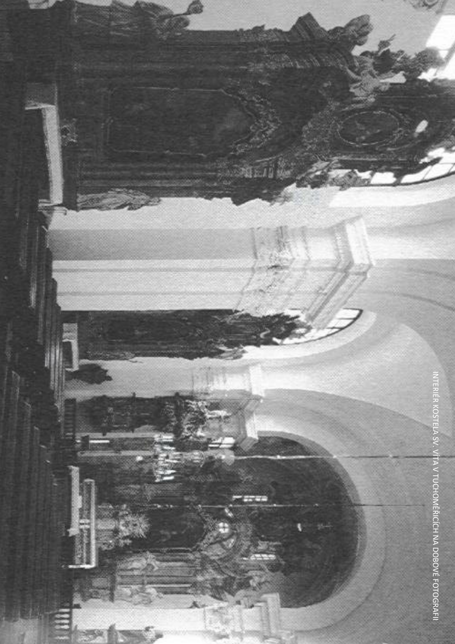
INTERIÉR KOSTELA SV. VÍTA V TUCHOMĚŘICÍCH NA DOBOVÉ FOTOGRAFII